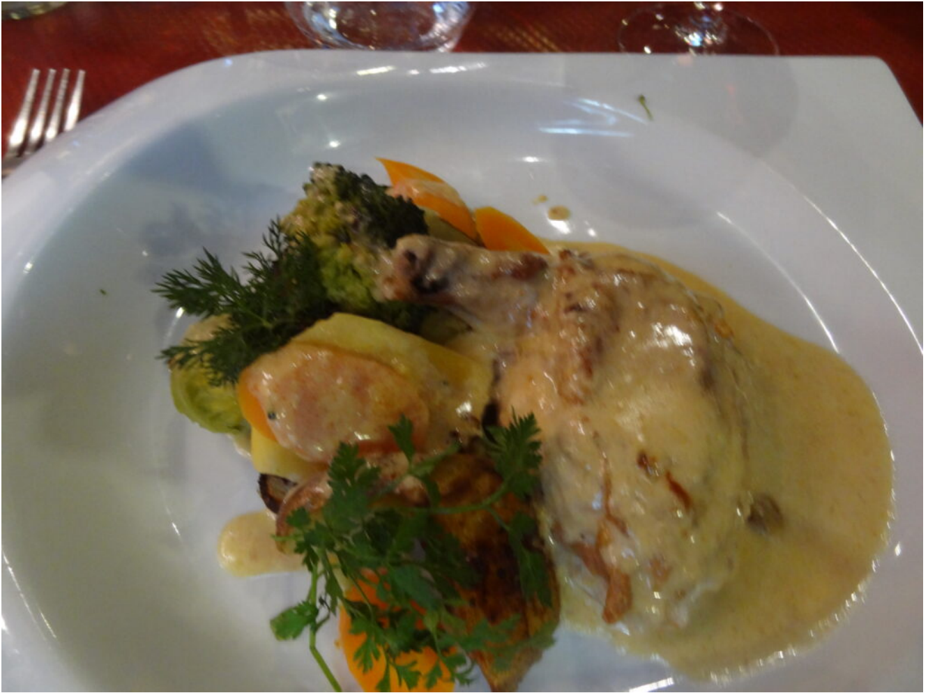
Volaille en sauce