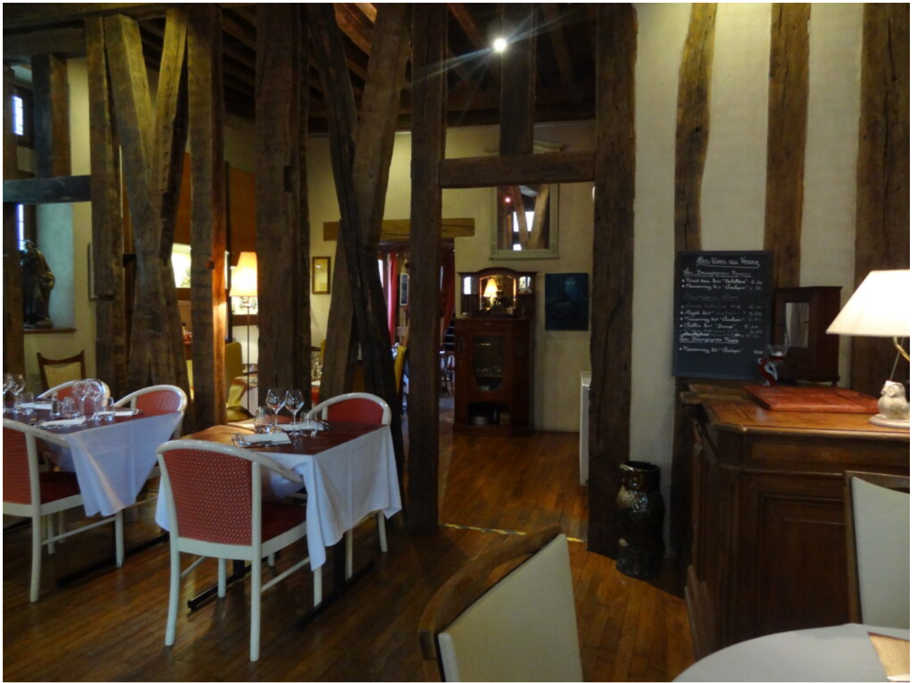
La salle du restaurant