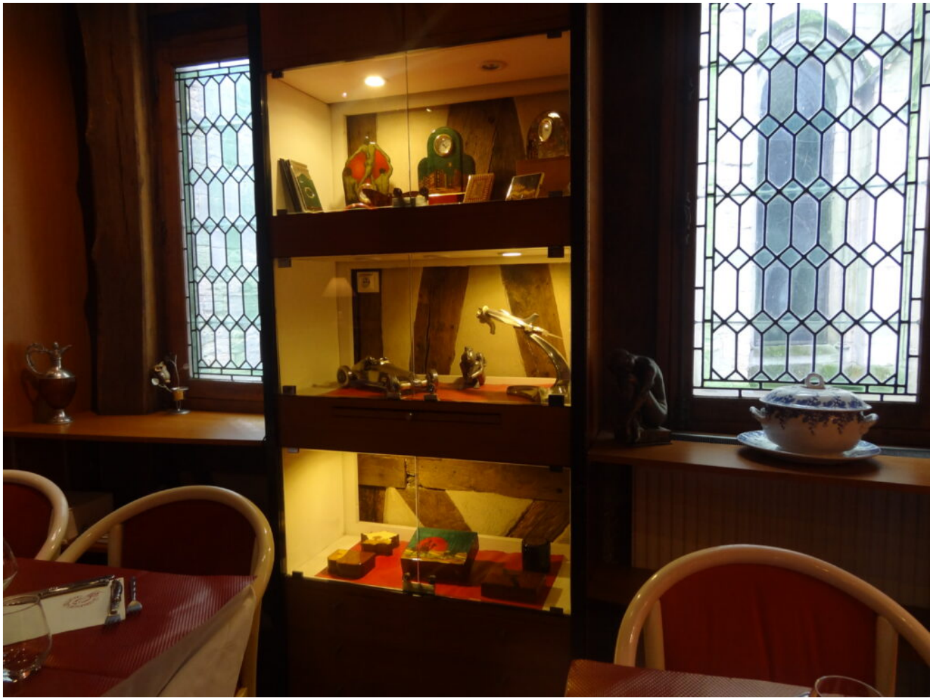
Décorations de la salle