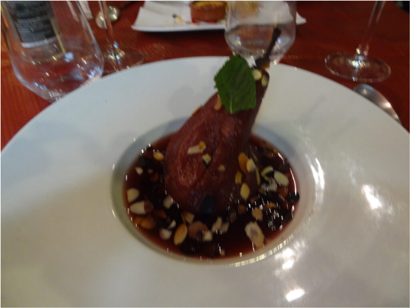
Poire au cassis