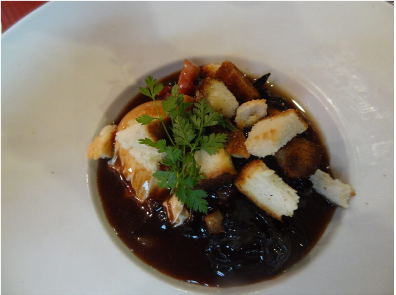
Oeufs en meurette