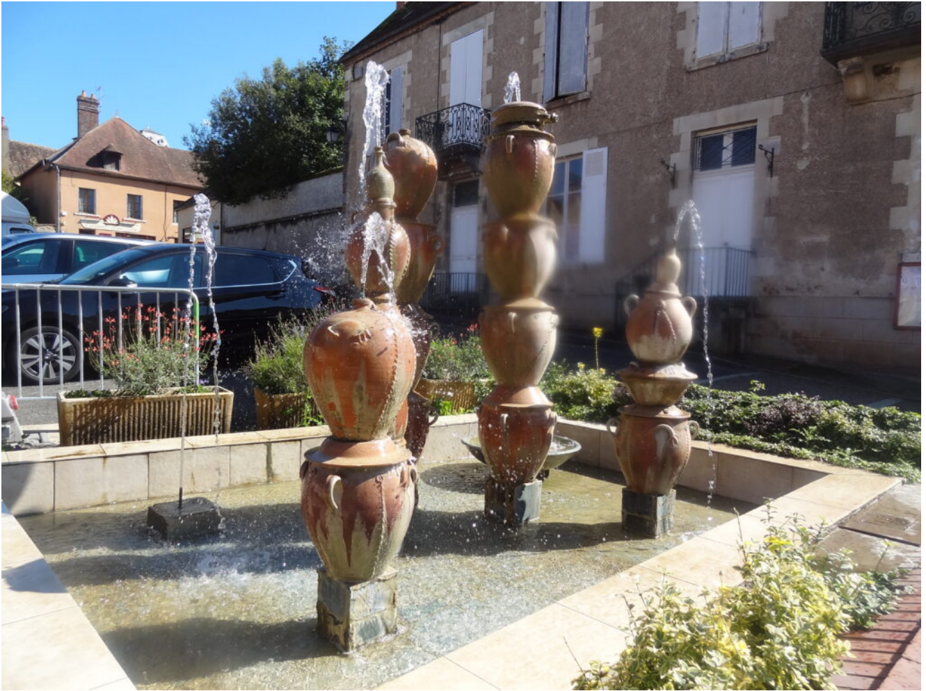
Village potier de Saint Amand en Puisaye