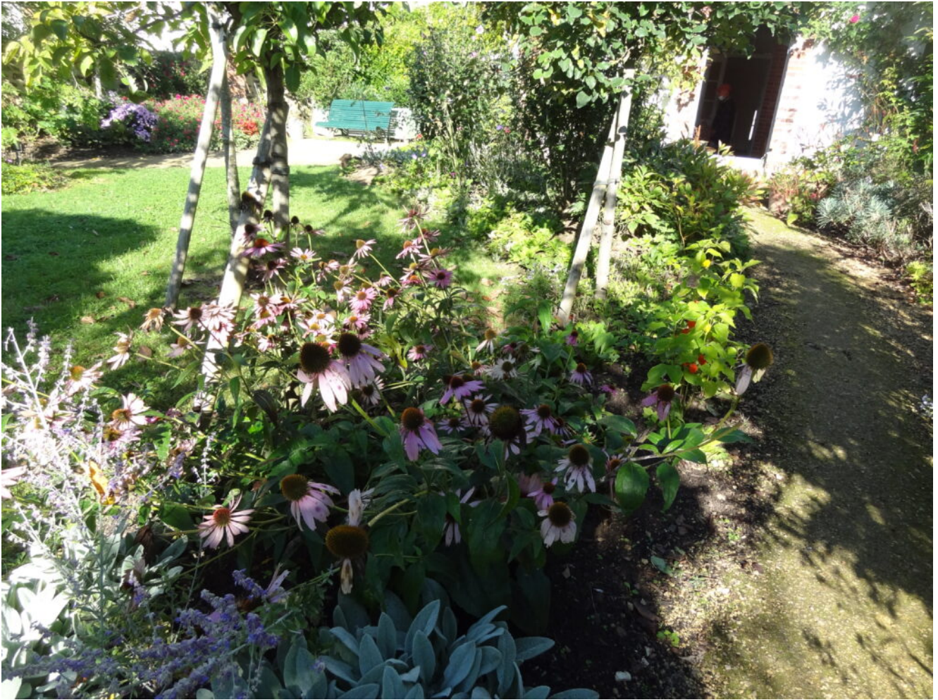
Le jardin de la maison