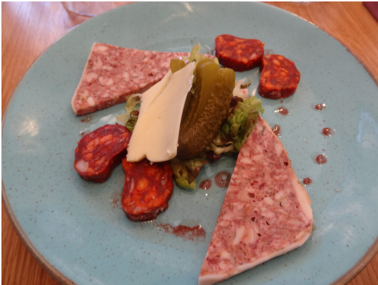
Assiette de charcuterie locale