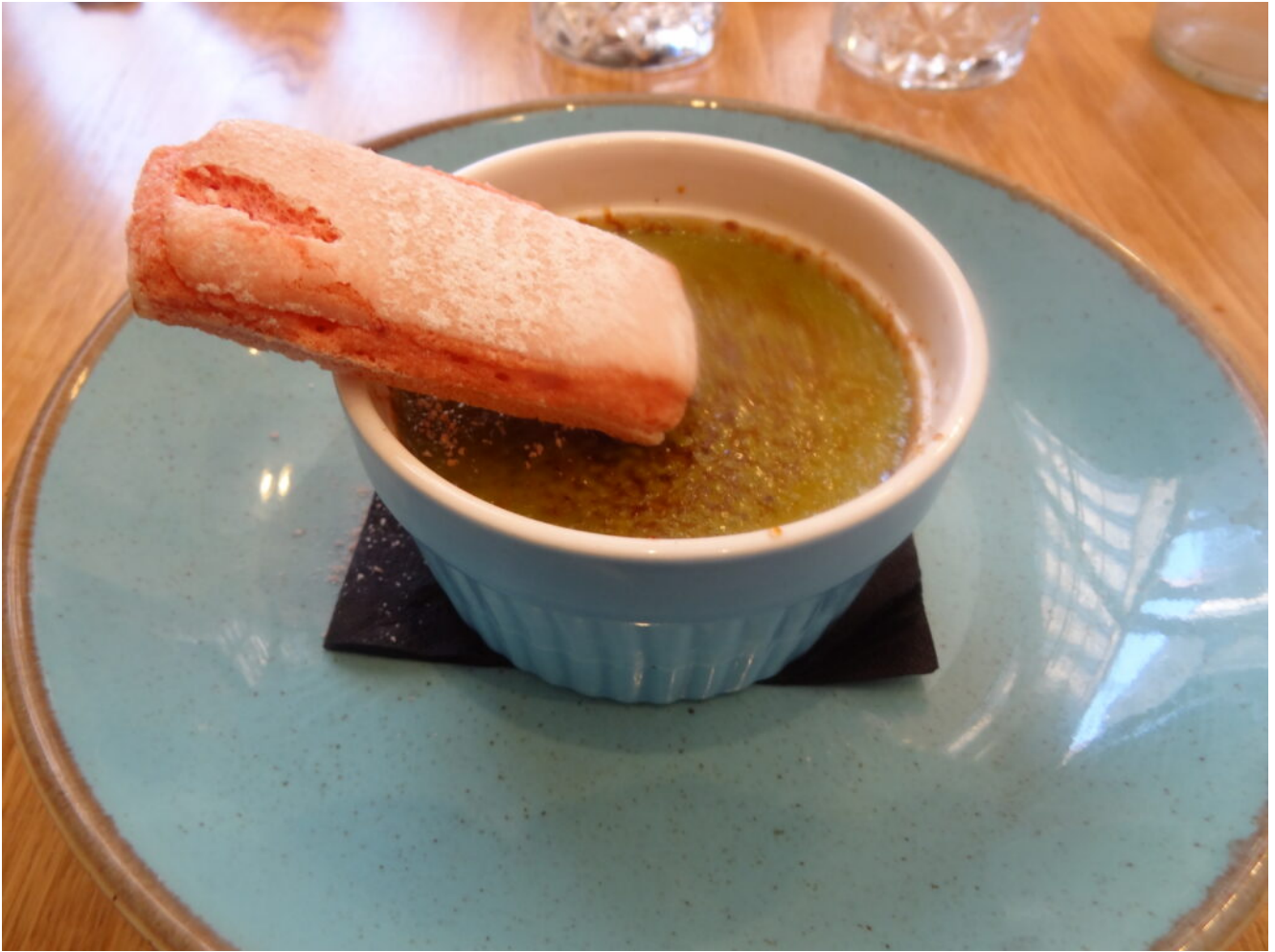
Crème brûlée au thé vert et son biscuit rose