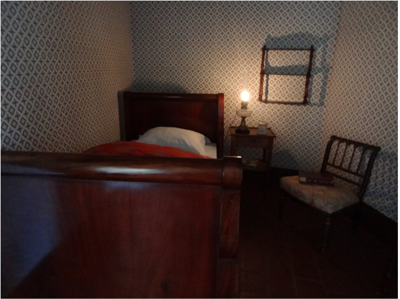
La chambre à coucher de Colette enfant