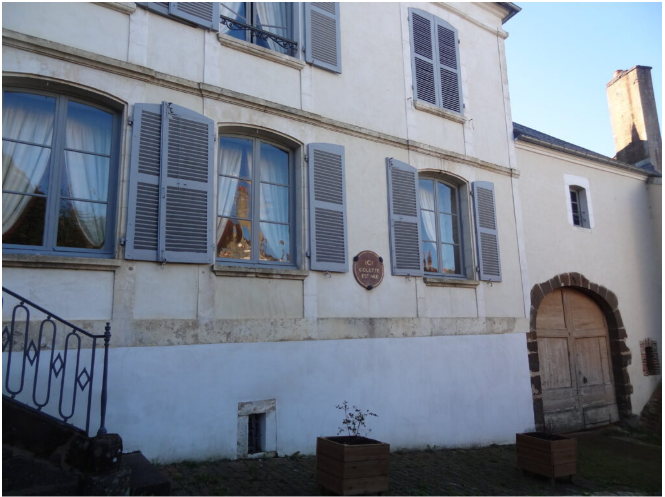
Maison natale de Colette , femme de Lettres , à Saint Sauveur en Puisaye