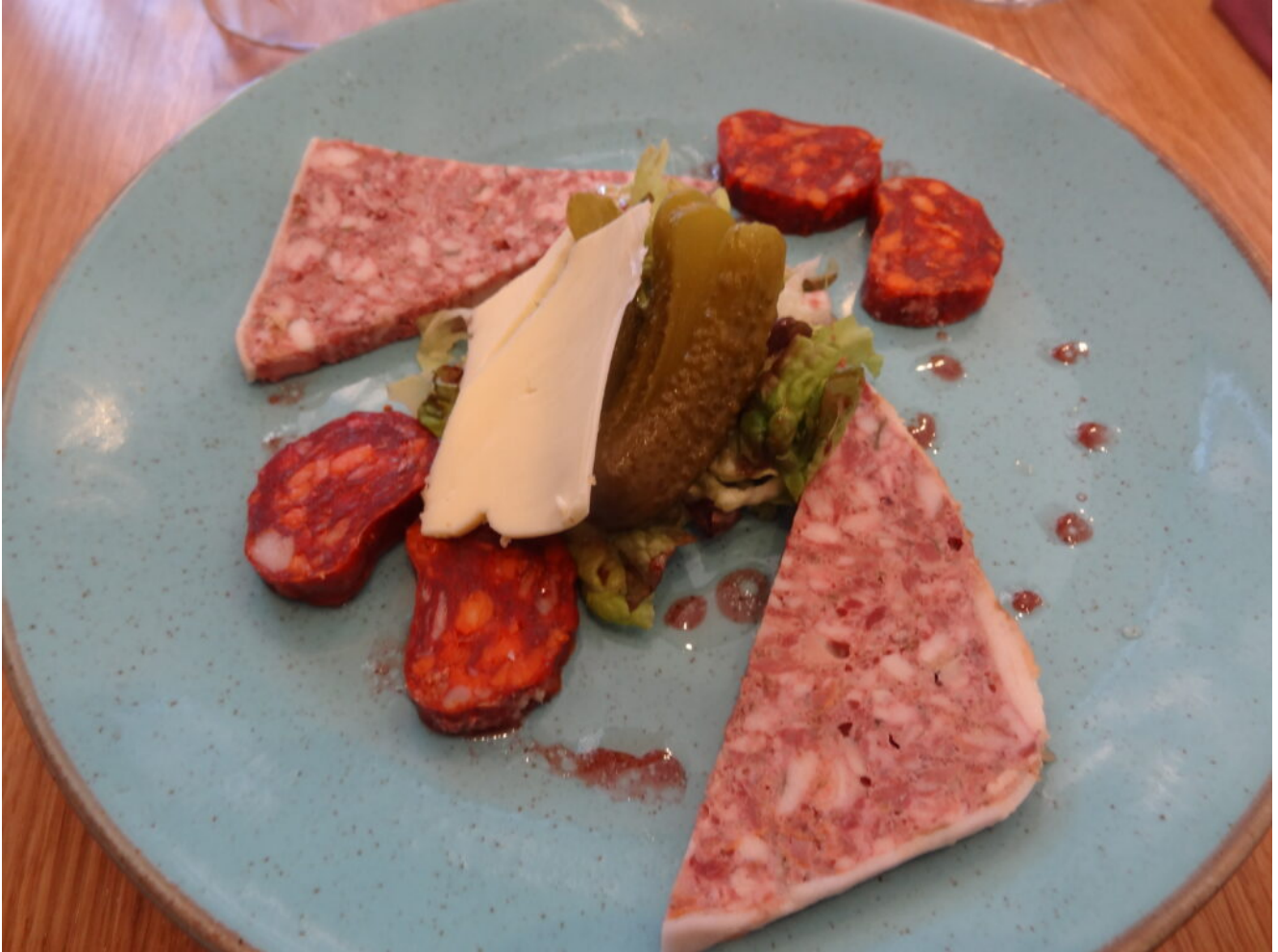
Assiette de charcuterie locale