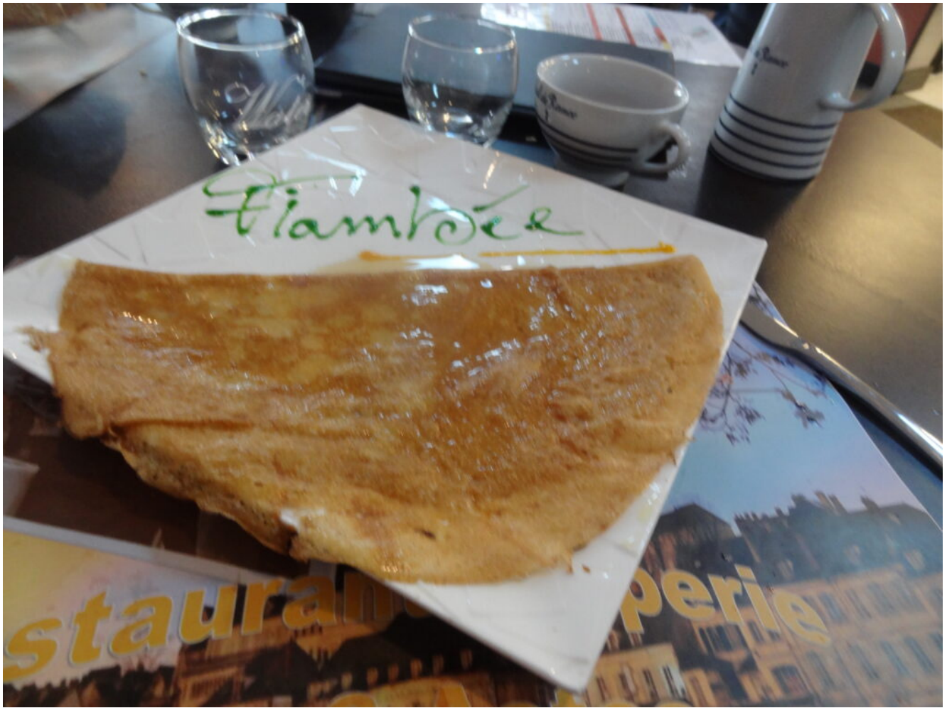
Crêpe flambée au Grand Marnier